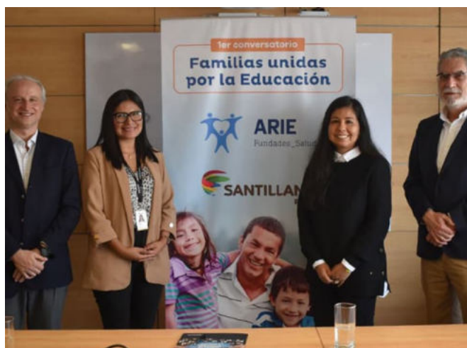
Aliança com o Instituto de Desenvolvimento Infantil - ARIE

Sendo eles o ativo mais valioso da Santillana, parte da nossa estratégia de sustentabilidade está focada em cuidar e promover este talento. Em 2022, oferecemos mais de 45.000 horas de treinamento para toda a nossa força de trabalho.