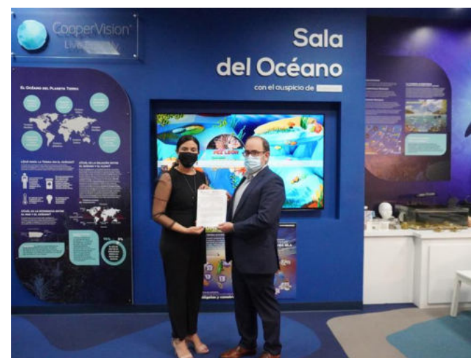
Acordo com EcoExploratorio

Alguns exemplos são a colaboração com a Fundação Cecilia Rivadeneira, no Equador; o convênio com a EcoExploratorio, em Porto Rico; ou a aliança com o Instituto de Desenvolvimento Infantil ARIE, no Peru.